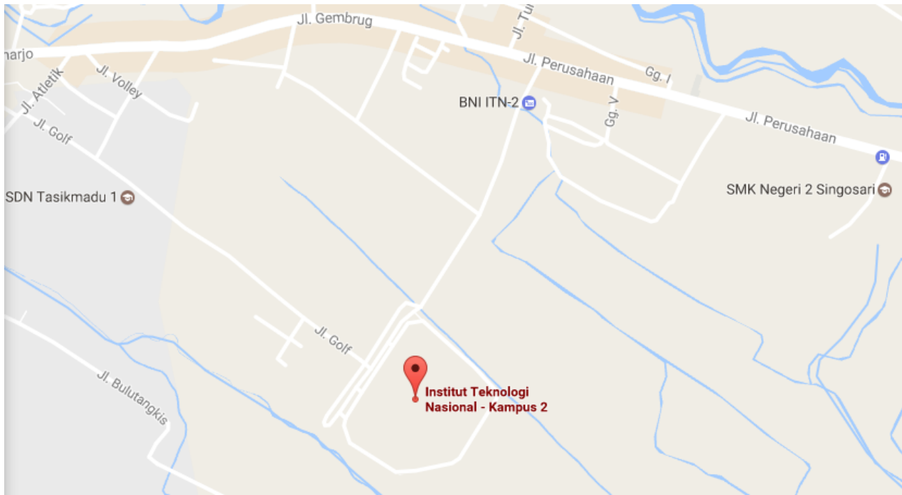
Gambar Letak Kampus 2 ITN Malang pada Google Map