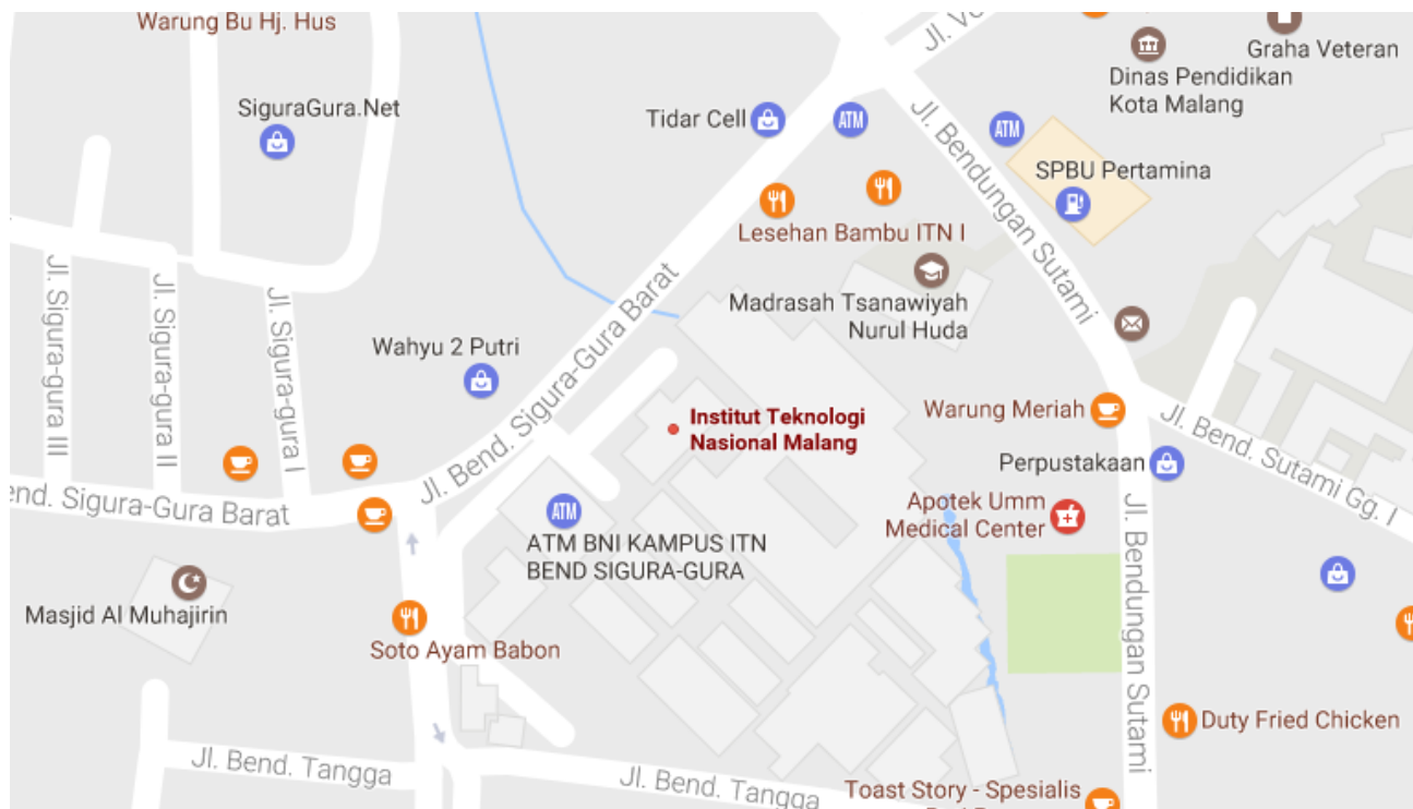
Gambar Letak Kampus 1 ITN Malang pada Google Map

Kampus pusat Institut Teknologi Nasional (ITN) Malang atau disebut Kampus 1 / Kampus ITN Sigura-gura berada di jalan Bendungan Sigura-Gura No. 2, Lowokwaru, Sumbersari, Kec. Lowokwaru, Kota Malang. Jika dilihat dengan menggunakan peta di Google Map maka terletak pada kordinat -7.957790 (latitude) , 112.612208 (longitude). Kampus ITN Sigura-gura ini adalah kampus pusat yang juga tempat perkuliahan untuk Fakultas Teknik Sipil dan Perencanaan.